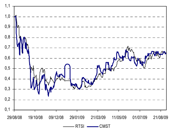
Динамика цены акций компании относительно индекса РТС